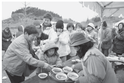
七百人が用意されたぜんざいのサービス