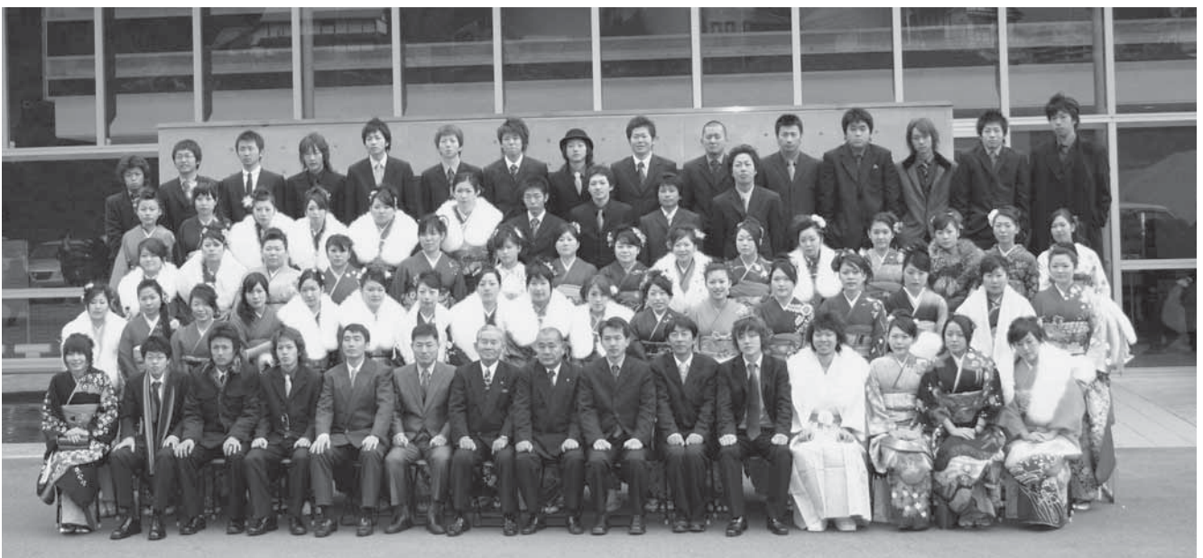
中央地区の新成人の皆さん