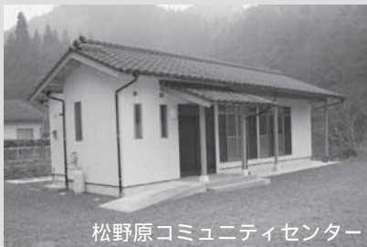
松野原コミュニティセンターは財団法人自治総合センターより宝くじ普及事業費として、助成を受け建設された「宝くじ助成施設」です。 平成 17年 1月

新築されたコミュニティセンターは、木造平屋建の61㎡で大会議室や調理室があり、松野原地区のコミュニティ活動の拠点として活用が期待されています。