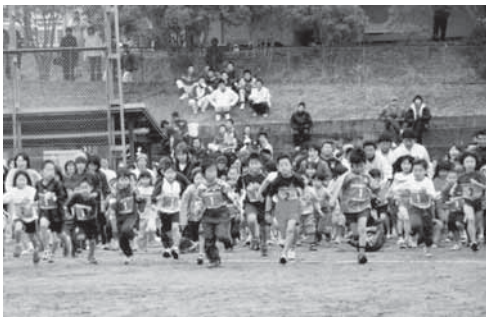
今年1年元気にスタートしました。