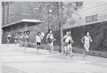
第1区のスタートの様子