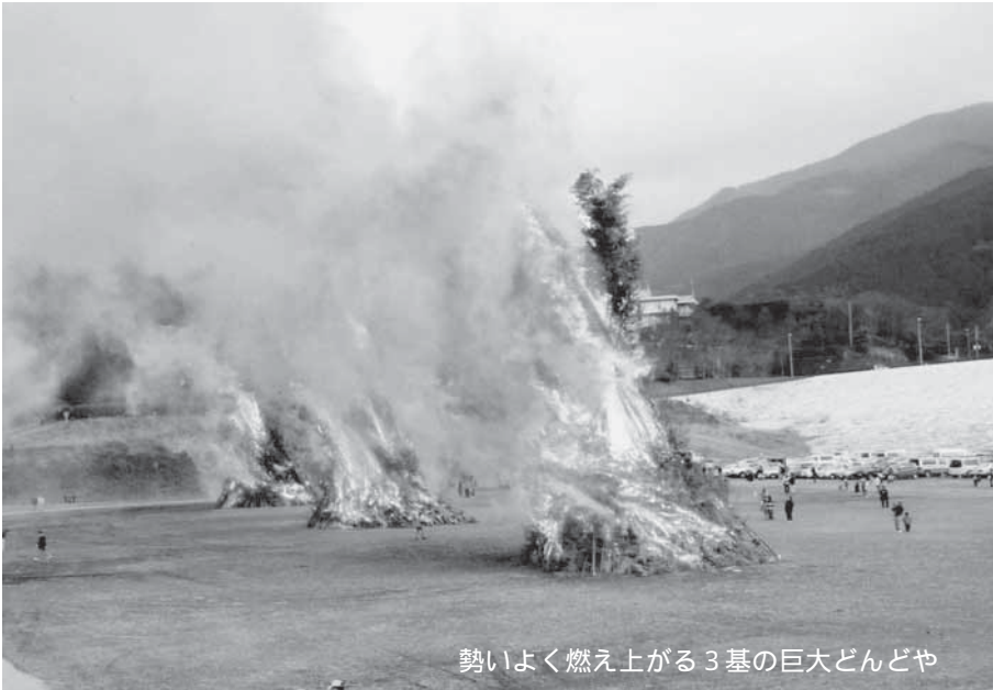
勢いよく燃え上がる3基の巨大どんどや