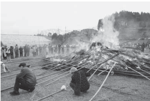
皆さん思いおもいにおもちを焼いていました