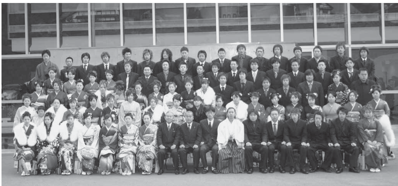
砥用地区の新成人の皆さん