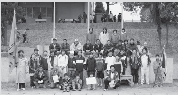
優勝した都原支部のみなさん