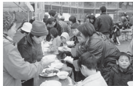
婦人会からおにぎり・ぜんざい・漬物が振る舞われました。