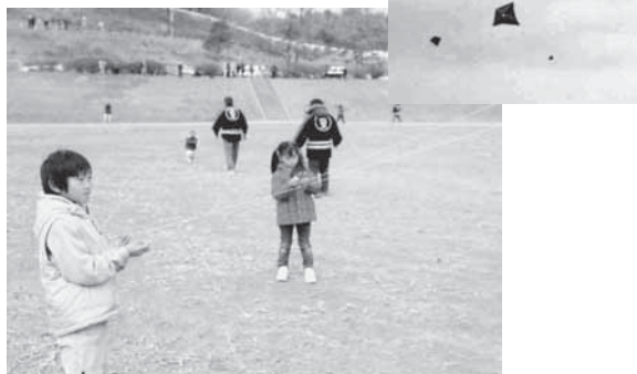
凧揚げ教室では子どもたちが楽しそうに凧揚げをしていました