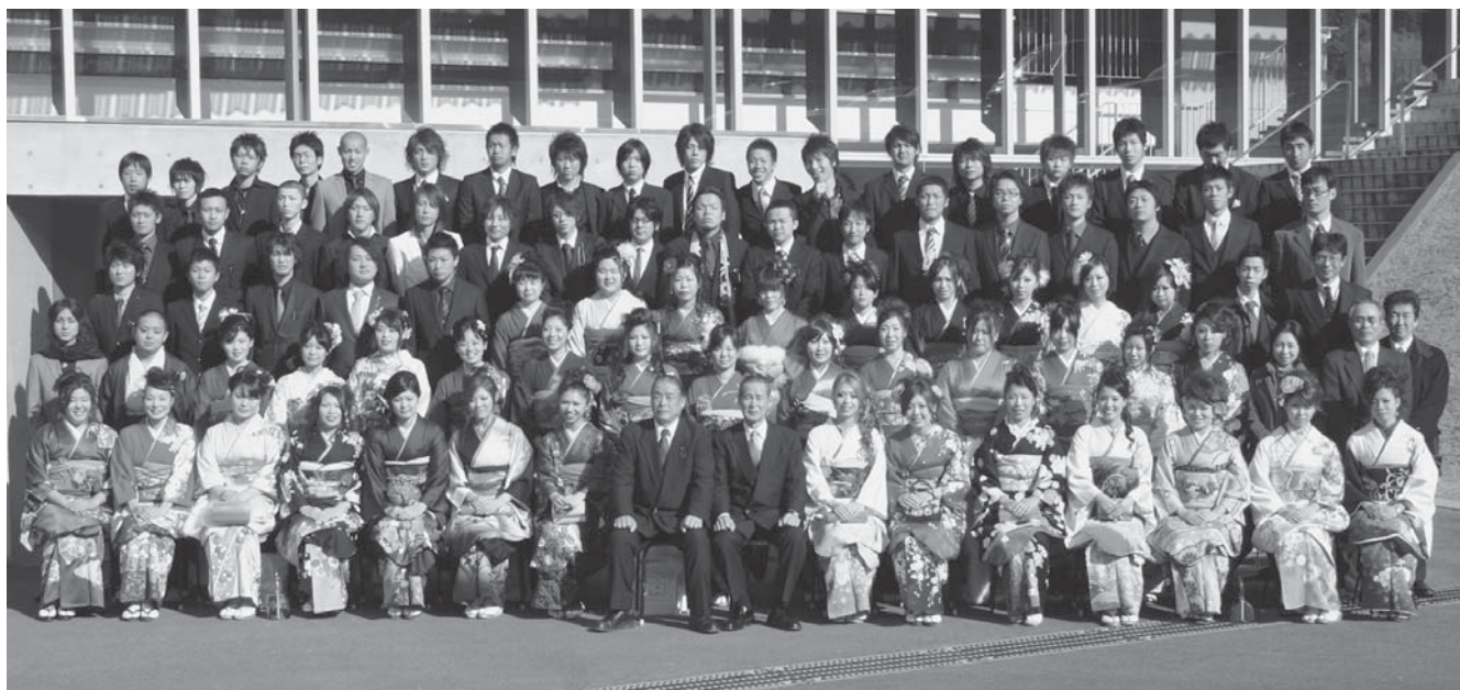
砥用中学校区の新成人の皆さん