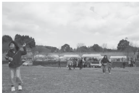
▲自分たちで作った凧で楽しそうに遊んでい ました(凧づくり教室)