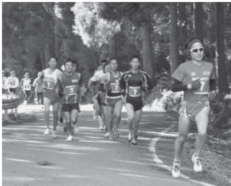
▲今年一年を、気持ちを新たに元気にスタート！

一月一日、町総合運動公園で、新春霊台橋マラソン大会が開催され、大人から子どもまで合計三百三人が参加されました。厳しい寒さの中でしたが、参加者たちは元氣いっぱい新春の走り初めを行いました。走り終わった参加者たちは、婦人会のみなさんが作った温かいぜんざいとおにぎりをおいしそうにほおばっていました。