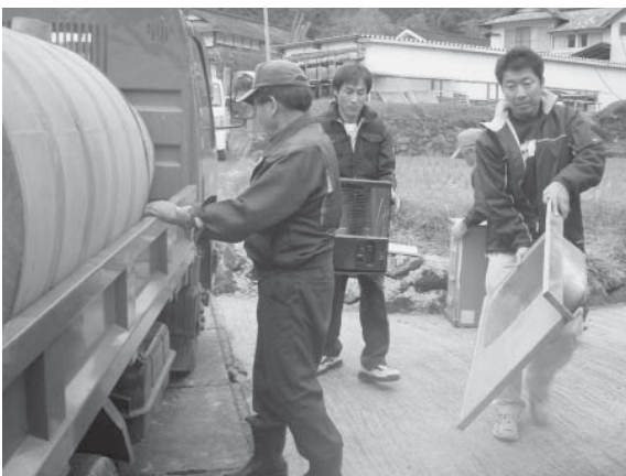
▲粗大ごみを収集するボランティアの方々