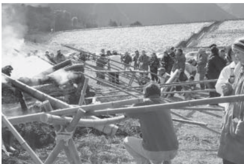
▲みんな思い思いにおもちを焼いていました

また、会場内では、あぶり竹やぜ んざいなどが販売されており、大 勢のお客さんで賑わっていました。 火が下火になると、みんな一斉にも ちを焼いたり、冷えた体を温めてい ました。