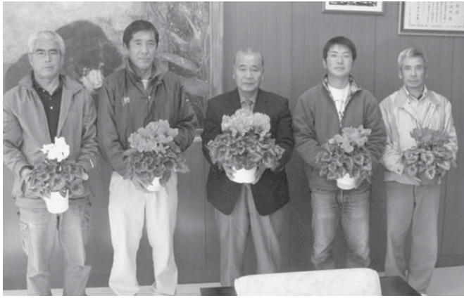
▲長嶺町長とシクラメン栽培組合のみなさん