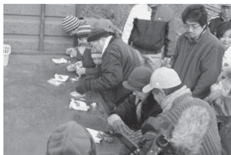
▲点火用の種火を作る採火式を行う 参加者

準備から協力していただいたYFA、 あぜみち会、婦人会、砥用活性化研究 会、ゆきぞの学園、美里町商工会青年部、 緑川ダム管理所、畝野老寿会、J A宇 城砥用支所、石段の郷「佐俣の湯」、緑 川ダム安全連絡協議会のみなさん、本 当にお世話になりました。