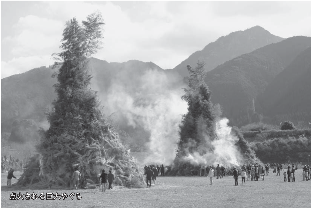
点火される巨大やぐら

一月十一日、緑川ダムイベント 広場で、「みどりかわ湖とんと祭り」 が開催されました。