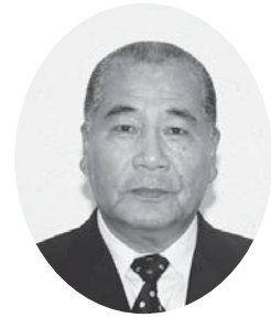
美里町長 長嶺 興也