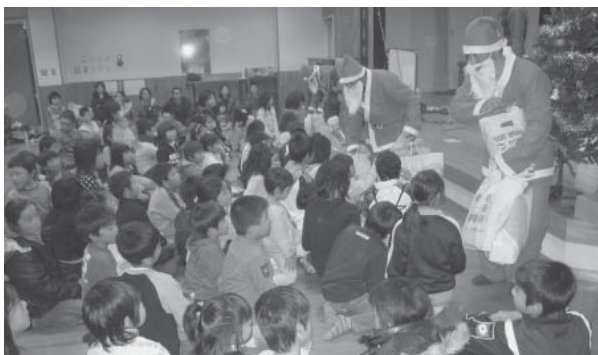
▶プレゼントをもらう子ども達

大満足。立派なクリスマスケーキが二十個出来上がり、みんなでおいしく食べました。最後は、サンタクロースが子どもたちみんなにプレゼントを渡して終了しました。子どもたちにとってはとてもいい思い出ができました。