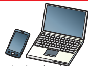
インターネット、気象庁ホームページ